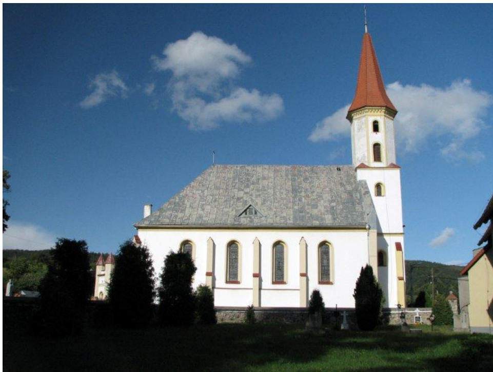
Kościół pw. Jana Chrzciciela