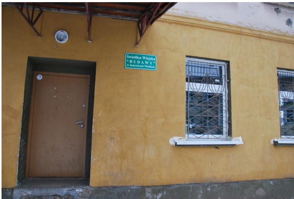
Świetlica wiejska „Rudawy”

Sołecka Strategia Rozwoju Wsi Janowice Wielkie