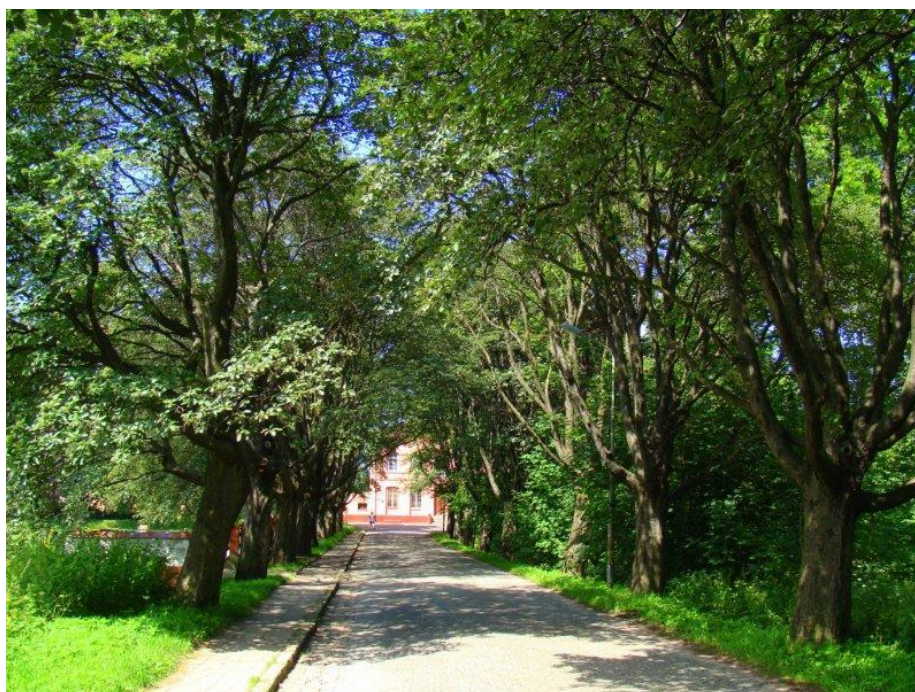
Aleja Jarząba Szwedzkiego ( w tle budynek stacji PKP)