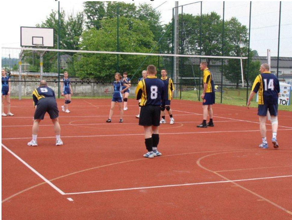
Kompleks sportowy „Orlik 2012”