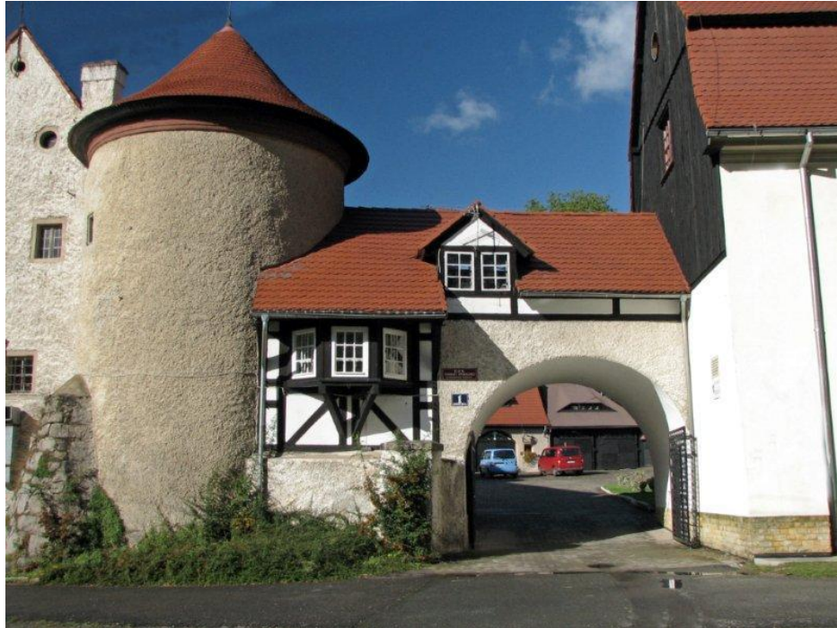
Pałac (obecnie Dom Pomocy Społecznej)